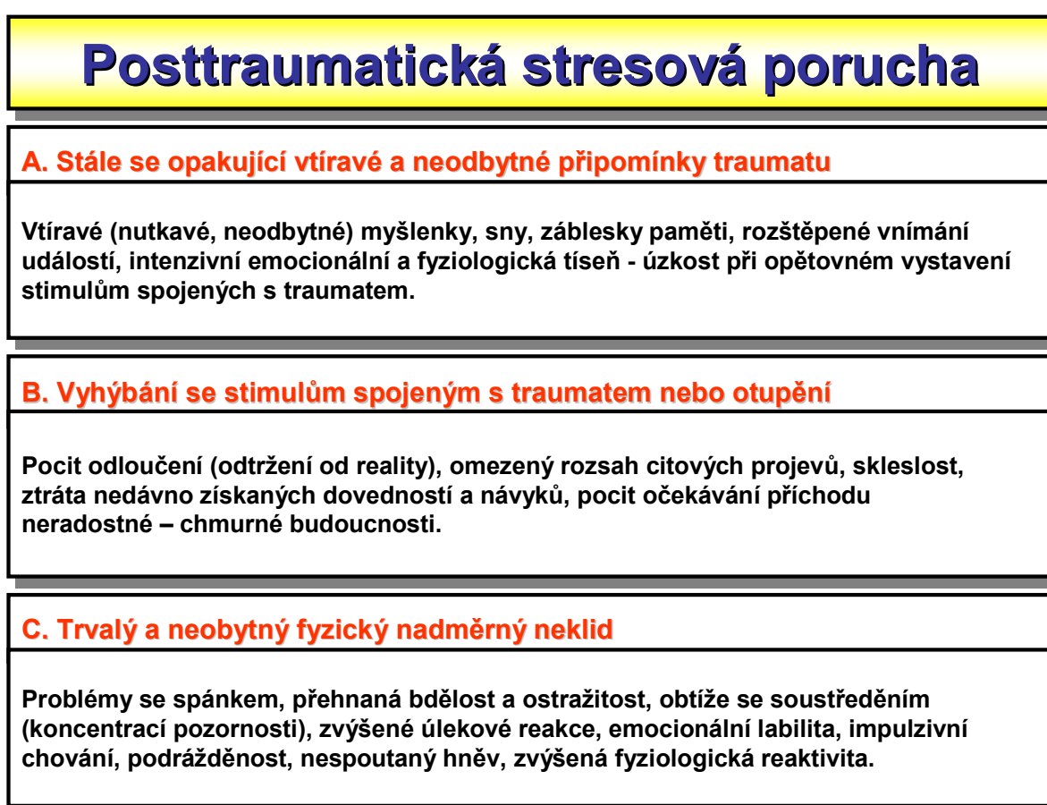
Obr. č. 1. Hlavní příznaky – symptomy – PTSD

V minulosti byla PTSD nazývána palebný šok, který vojáci utrpěli v důsledku boje nebo tím, že na ně byla vedena palba. Tento název byl používán až do osmdesátých let minulého století, kdy pojmenování nemoci bylo změněno na posttraumatická stresová porucha. Od té doby je i ostatním lidem, kteří nebyli v boji, ale stali se obětí dopravních nehod, domácího násilí, znásilnění, incestu nebo jiných traumat, konečně poskytována potřebná pomoc a také samotná porucha byla jasně definována, popsána a zkoumána. To, co člověk prožije v traumatu, nikdy nezapomene. 6