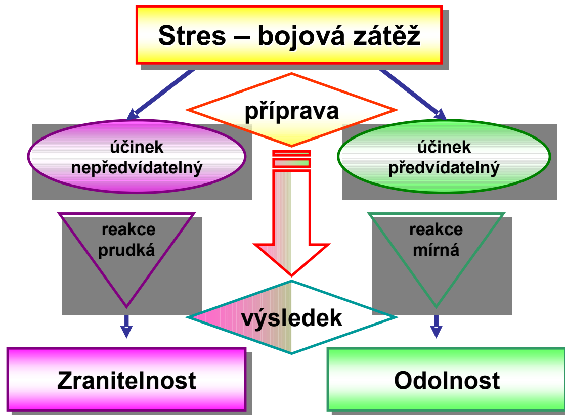
Obr. č. 2. Vztah mezi přípravou a stresem – bojovou zátěží